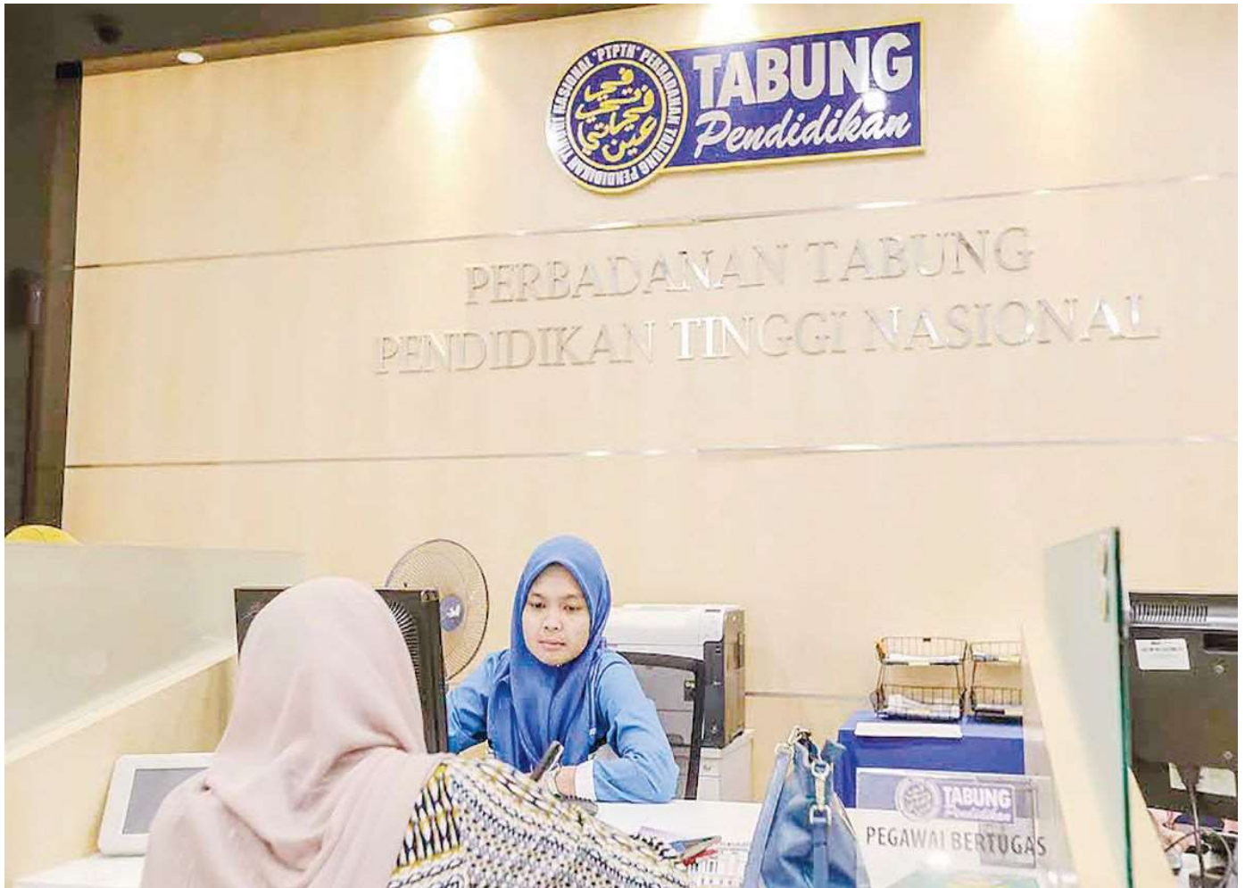
PTPTN berharap para peminjam dapat membuat bayaran balik secara konsisten dan teratur. – Gambar hiasan