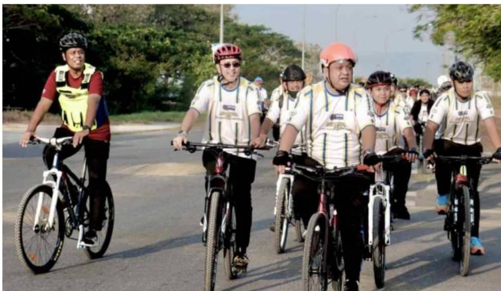
Tuanku Syed Faizuddin (tengah) berkenan menyertai aktiviti kayuhan sempena Program Kayuhan Sejuta Kasih PTPTN melibatkan pelbagai jabatan kerajaan dan agensi swasta.

KANGAR - Program Kayuhan Sejuta Kasih Perbadanan Tabung Pendidikan Tinggi Nasional (PTPTN) bersama Raja Muda Perlis, Tuanku Syed Faizuddin Putra Jamalullail diyakini mampu memupuk budaya gaya hidup cergas dan sihat selain mengeratkan silaturrahim antara pemimpin dan masyarakat Perlis.