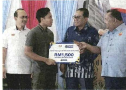
Menteri Pendidikan Tinggi, Datuk Seri Mohamed Khaled Nordin (dua dari kanan) menyerahkan plakad WPP kepada seorang pelajar penerima WPP yang diadakan di Kota Tinggi, Johor.